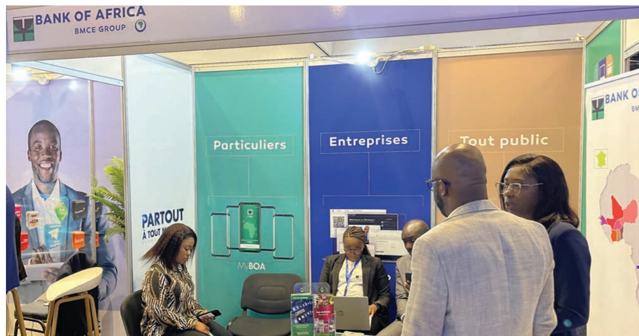
Stand BOA au forum E Commerce