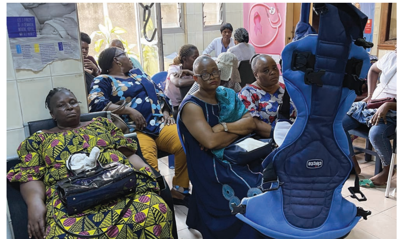
Campagne de dépistage des cancers du sein et du col de l'utérus