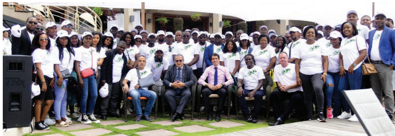
Cérémonie de présentation des vœux